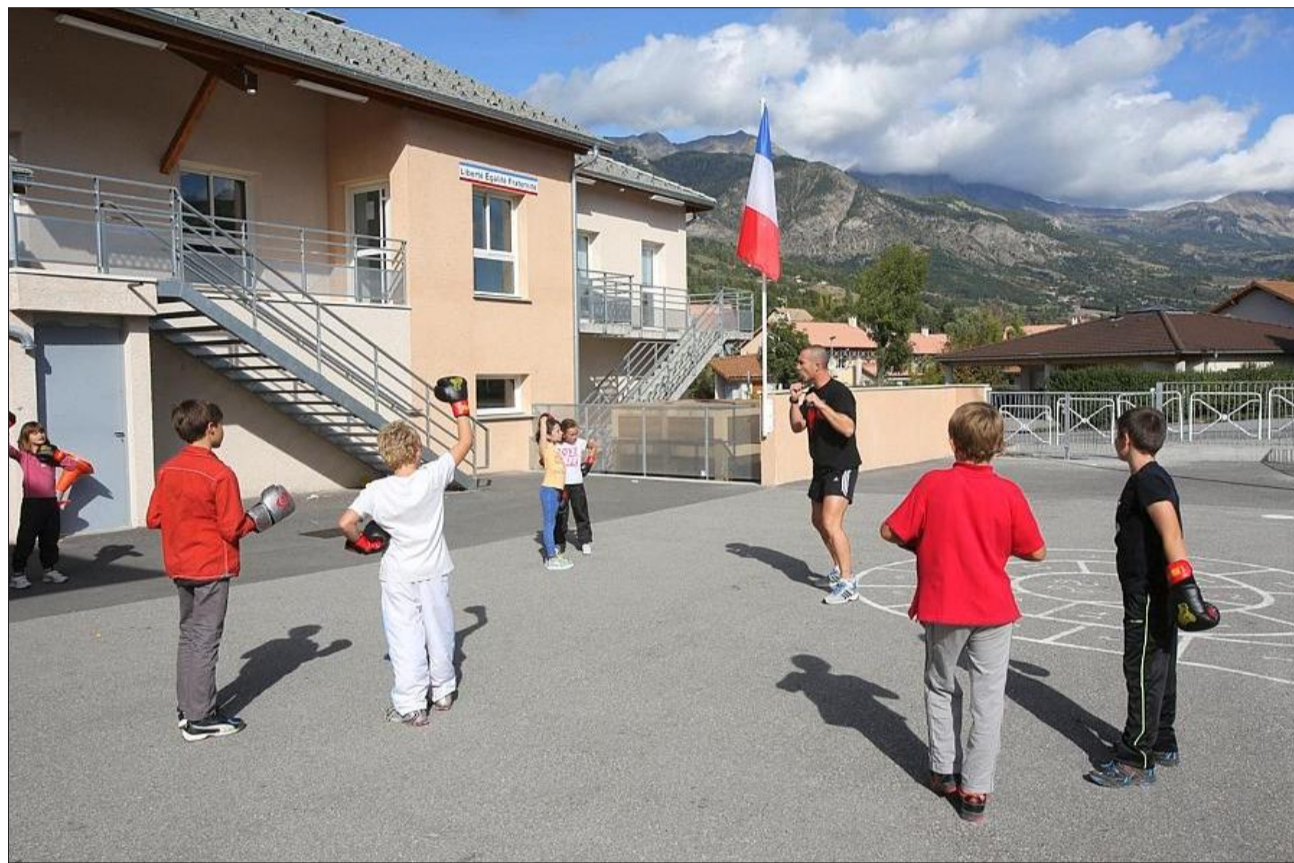
À La Bâtie-Neuve, la commune comme les enseignants affichent leur satisfaction sur la réforme engagée. Ce n'est pas le cas des parents d'élèves délégués qui sont plus critiques.

Comme par exemple L'Argentière-la-Bessée qui n'a pas finalisé la mise en place des TAP et devrait les ajuster en janvier 2014. Ce qui a engendré une insatisfaction générale et une