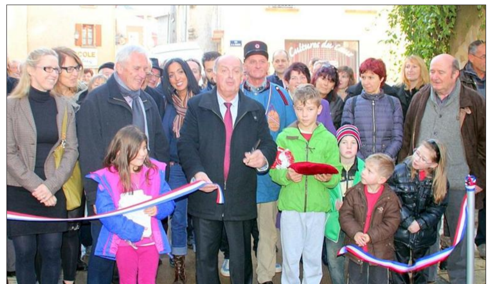
Le maire a coupé le ruban, hier matin, en présence d'au moins 250 personnes.

Le maire : « Un symbole de notre ambition »