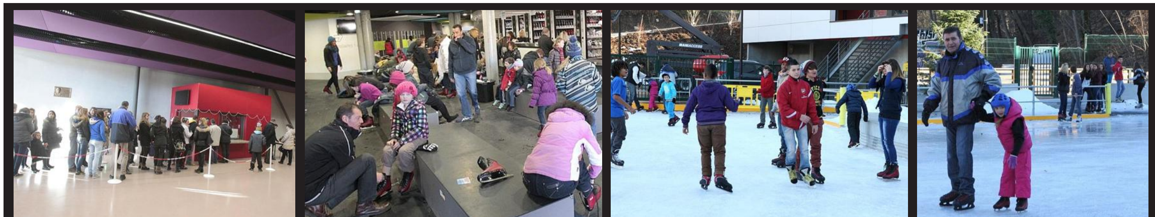
L'Alp' Arena aura fait le plein en ces vacances de Noël avec un record de 638 patineurs en une après-midi, jeudi. La patinoire a encore de la marge puisqu'il peut y avoir jusqu'à deux patineurs pour trois mètres carrés. Cette affluence peut simplement poser des problèmes de disponibilité des patins dans certaines pointures. Des patins désormais jamais humides et plus hygiéniques grâce à un système de séchage. Pendant les vacances, la glace attire surtout les jeunes et les familles dont des touristes.