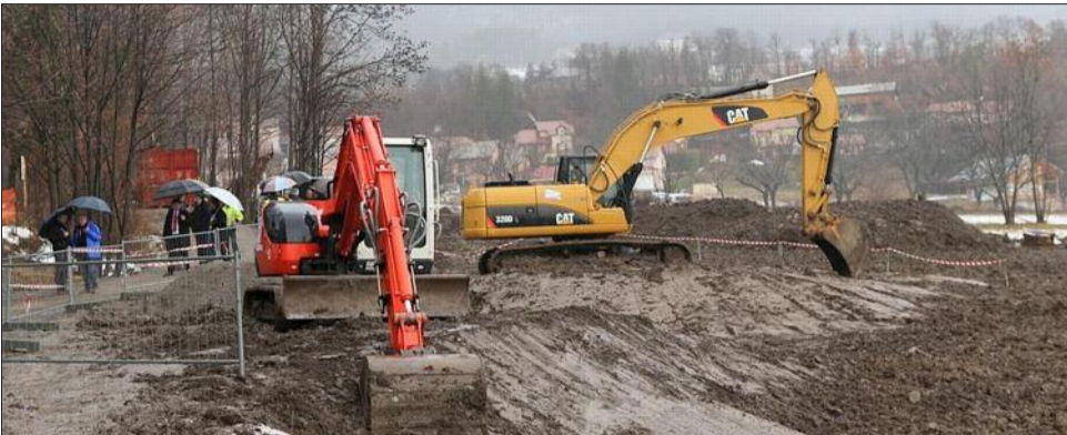
Inscrit parmi les deux priorités du contrat État-Région, la construction de la rocade gapençaise, Roger Didier s'est toutefois inquiété : « L'écotaxe était basée sur un réseau de 11,000 km de routes, le nouveau dispositif porte sur 4 000 km ».

À l'occasion du vote d'un avenant au conseil local de sécurité et de prévention de la délinquance, Jean-Claude Eyraud a interpellé Roger Didier sur la politique de la Ville. Dans le cadre du dispositif d'aide de l'État aux quartiers, récemment annoncé par la ministre, Gap reste concerné. « Il y aura une aide en faveur d'un seul quartier dont l'épicentre sera sûrement les coteaux du Forest, a expliqué Roger Didier, mais