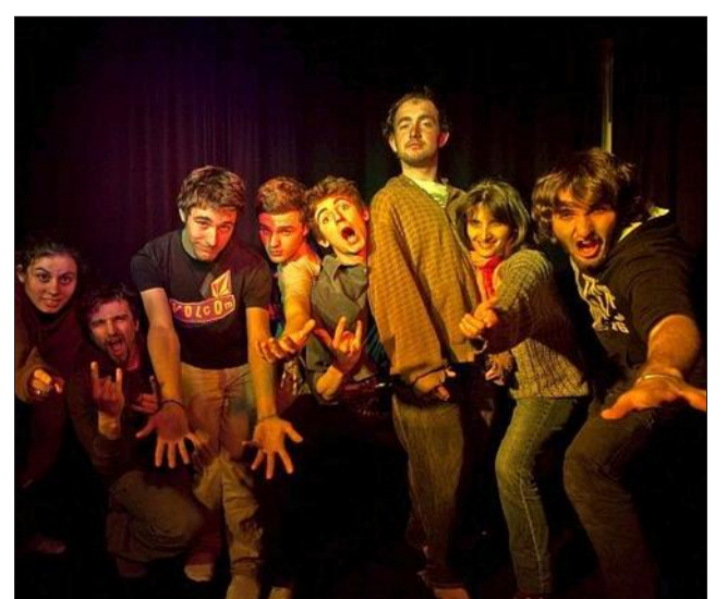
Acteurs et figurants lors du tournage du clip "Mon Coloc", titre phare du groupe gapençais Zomething.